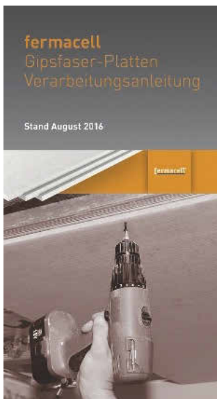
Die neue Verarbeitungsanleitung Gipsfaser-Platten ist online verfügbar sowie unter facebook und auf der Fermacell App.

Gipsfaser-Platten sind die Allrounder im Trockenbau. Sie vereinen unterschiedliche Plateneigenschaften in einem